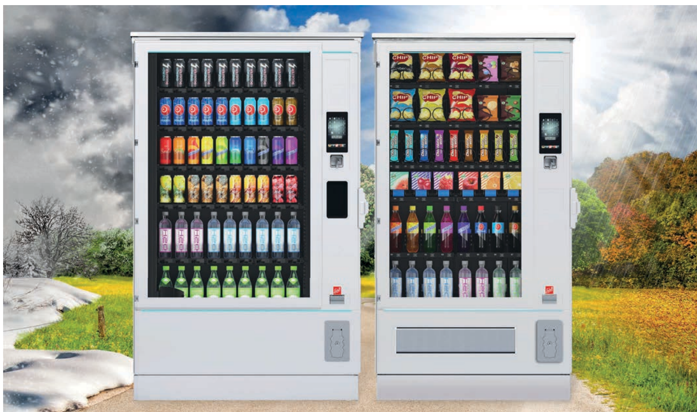
SiLine® GF L RO en couleur standard RAL 9010

SiLine® Outdoor : une prise électrique et le tour est joué, les distributeurs sont prêts à vendre par tous les temps.